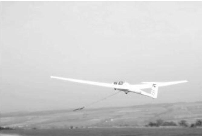
ASK 21 E6 Im Start auf dem Dingel am 28-03-2003