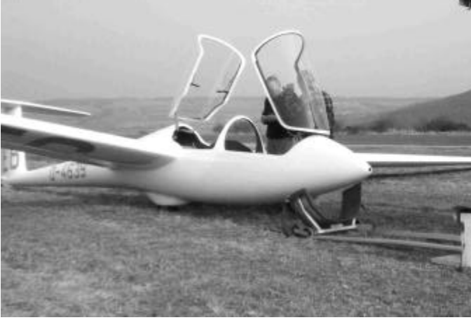
ASK 21 E6 Vorbereitung zum Checkflug