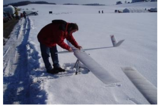
Wettbewerb im Schnee