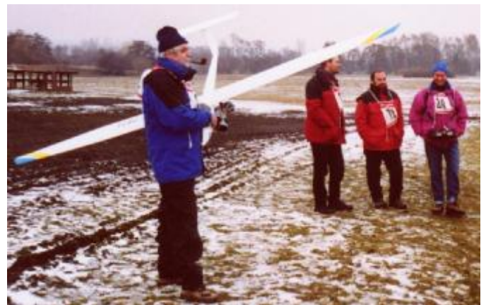
Elektrofliegen in Wetzlar