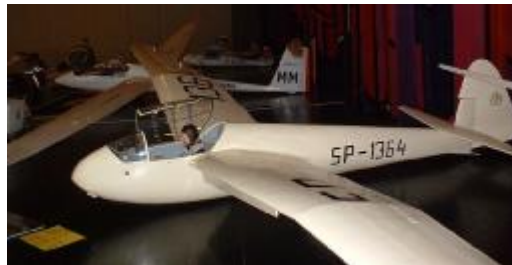
Unsere Prachtstücke in der Stadthalle Baunatal