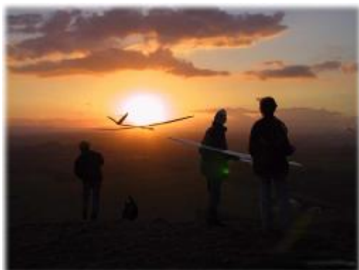
Sonnenuntergang am Isthia - Berg

Anmerkung: Durch ein Versehen der Redaktion wurde dieser Beitrag in der März – Ausgabe übersehen.