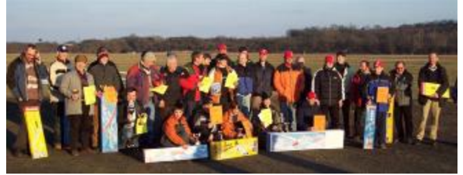
Gruppenbild mit Kasseler Team Einschöner Tag