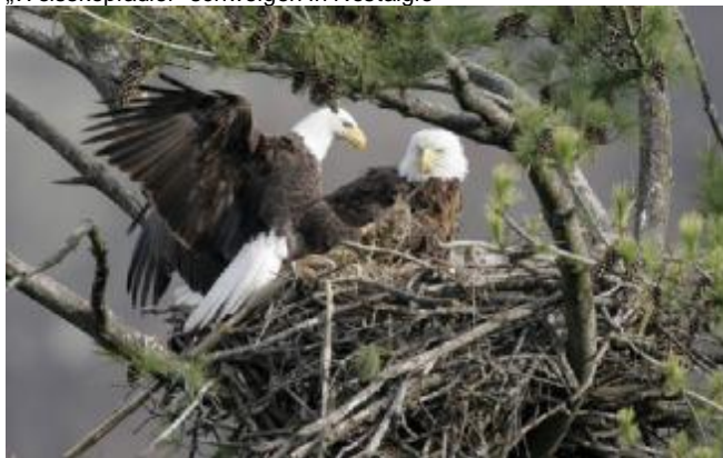
Das sind die Echten!