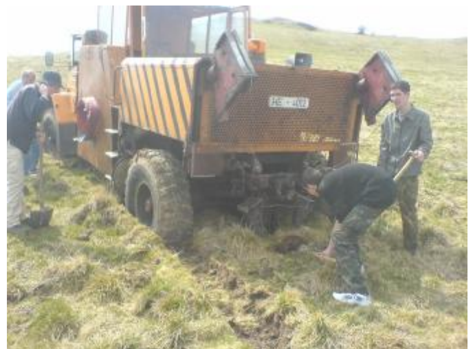
Die Winde ist tief eingesunken...