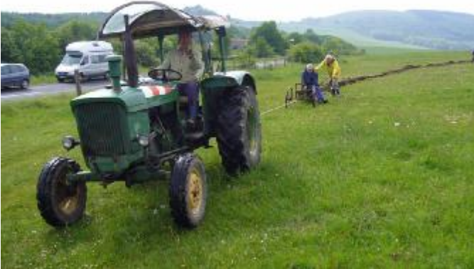
Volkmar hält die Richtung...