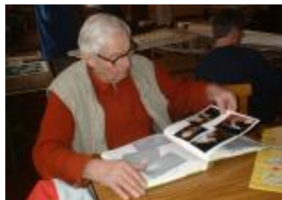
„Weisskopfadler“ schwelgen in Nostalgie